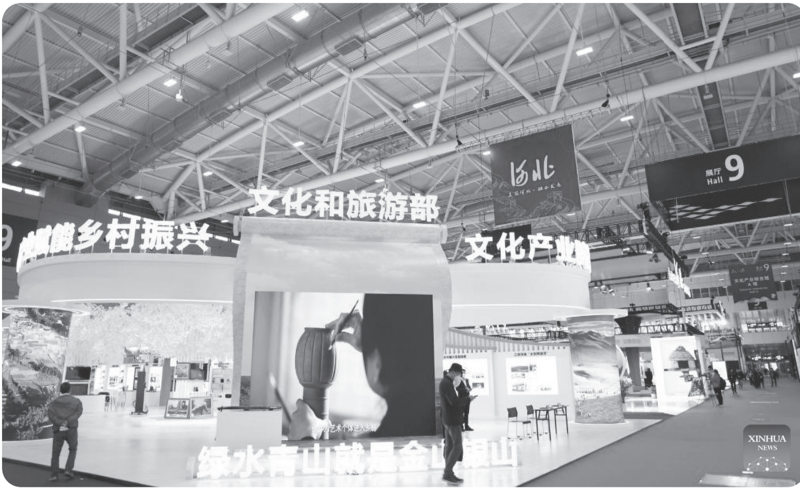
PAMERAN INDUSTRI BUDAYA INTERNASIONAL TIONGGOK

Foto yang diambil pada Rabu (28/12) ini menunjukkan stan di Pameran Industri Budaya Internasional Tiongkok (Shenzhen) ke-18 di Shenzhen, Provinsi Guangdong, Tiongkok. Pameran Industri Budaya Internasional Tiongkok (Shenzhen) ke-18 dimulai pada hari Rabu.